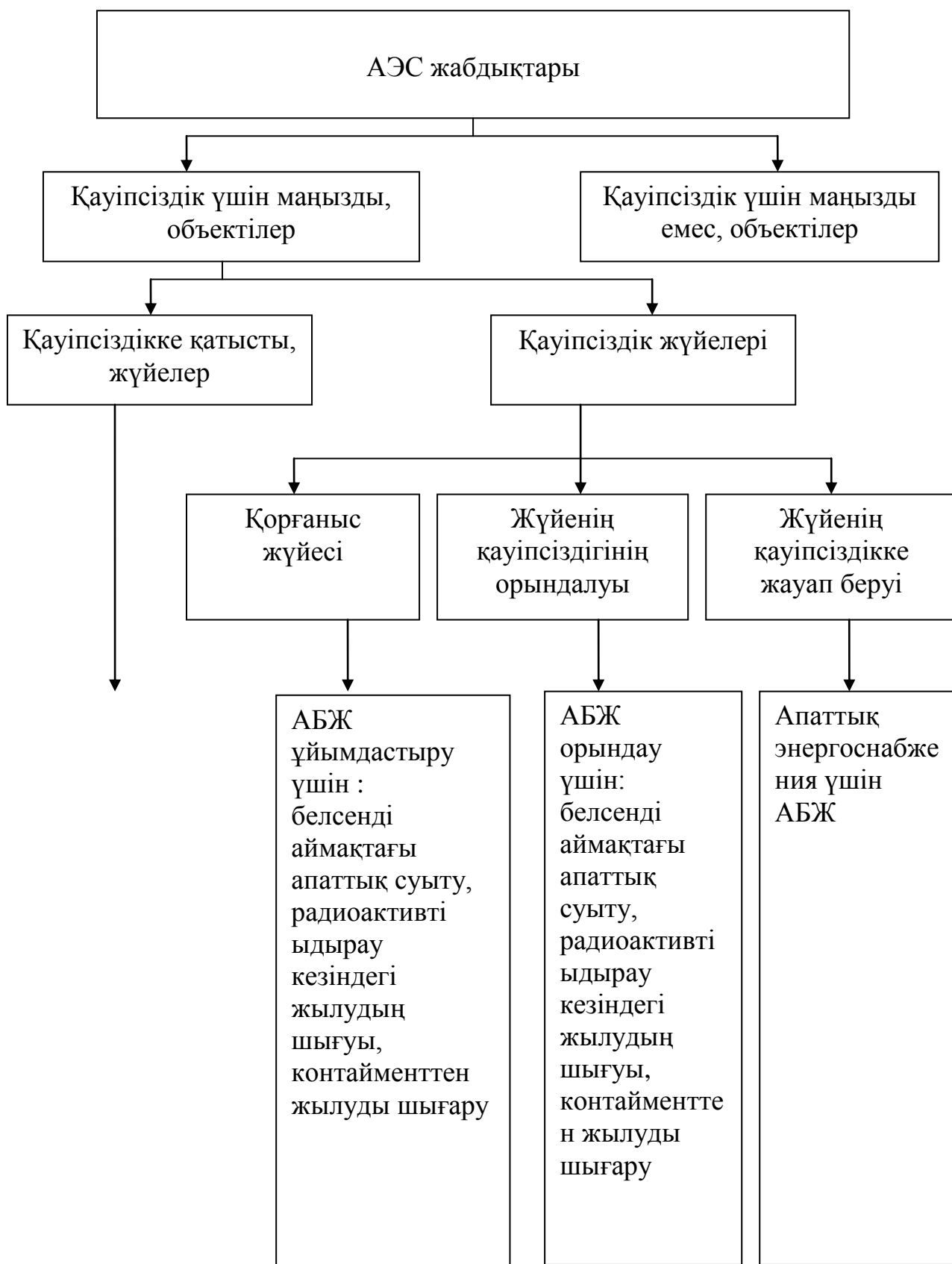
сурет2. МАГАТЭ құжаттарына сәйкес АБЖ қауіпсіздігі үшін маңызды классификацияларға мысал.