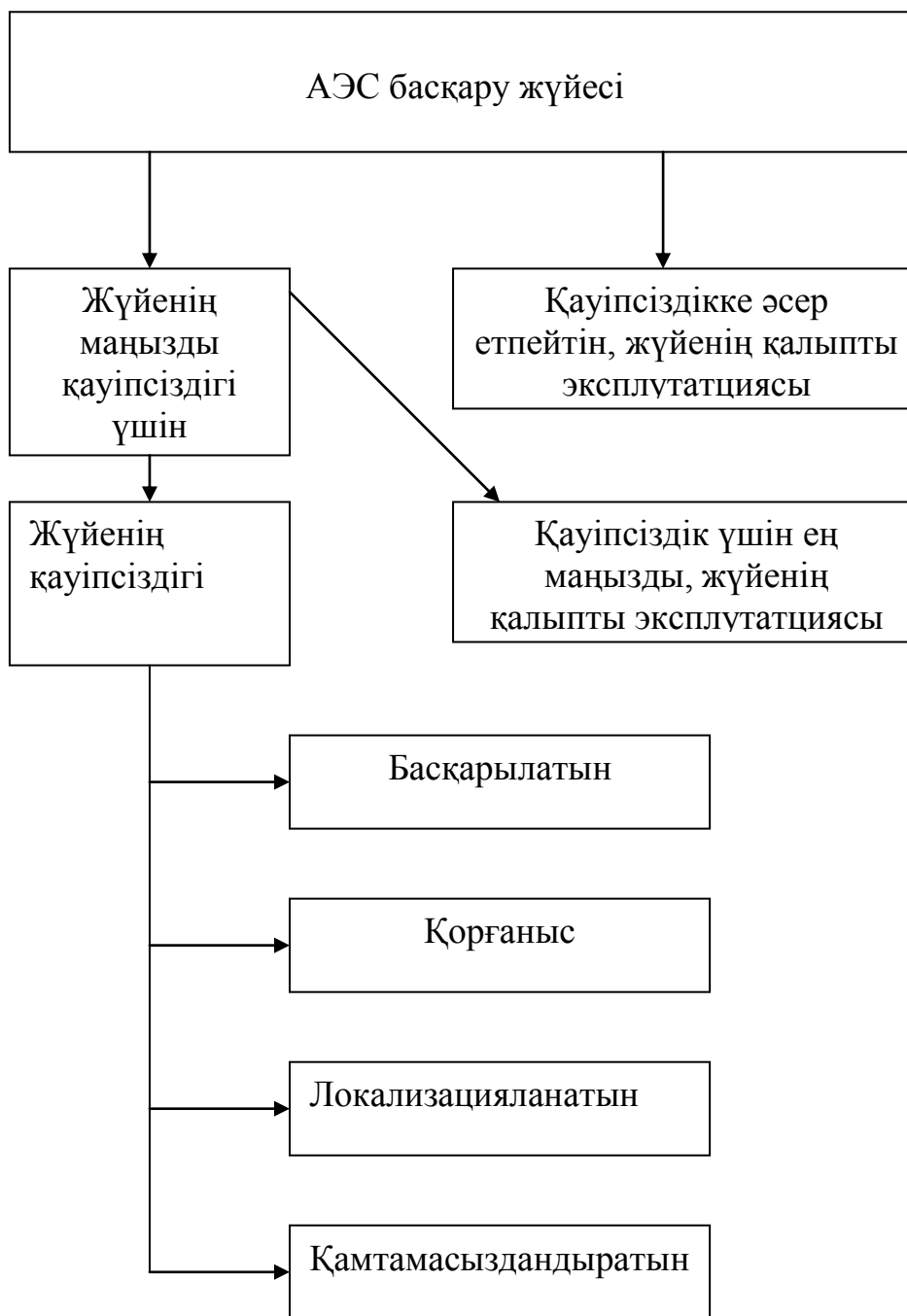
Сурет1. АЭС қауіпсіздігіне сәйкес элементтер және олардың классификациясы «Атом электр станцияларындағы ортақ қамтамасыздандыру жағдайы».